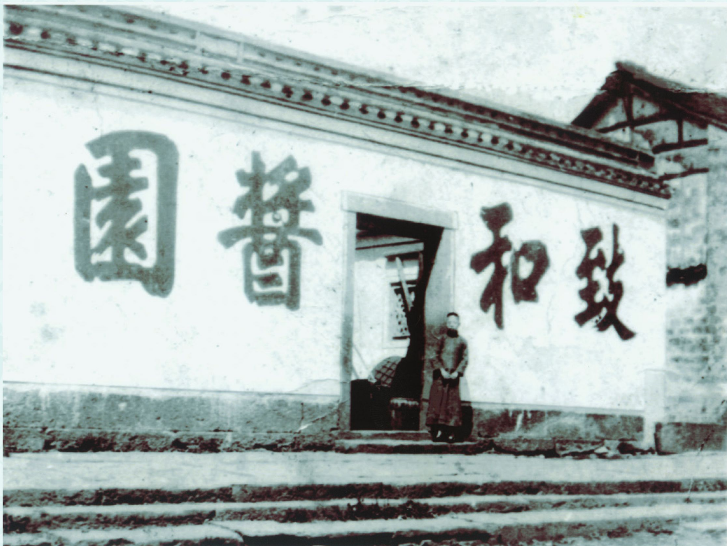
致和醬園照片（照片选自网络）

1861), 才有余姚朱姓、宁波李姓、慈溪郑姓和叶姓集资纹银一万八千两, 来扩展致和醬園的规模。当时聘请一王姓经理, 因经营有方, 业务不断扩大, 经济实力渐强, 遂购置栈房和晒场用地。早年的致和醬園仅仅是从衙弄口西侧临街朝南一段, 此时致和醬園的地段和房屋已从后门跨过后街延伸, 致和醬園的产业连成一大片, 其面积要占和鸣桥以东街道的三分之一。嘉庆四年(1799), 致和醬園的西邻开设了鼎和醬園, 后又在鼎和醬園的毗西开了具美醬園。由此, 醬園街之名也随之诞生。