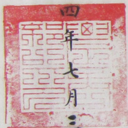
農商部頒發赴美國巴拿馬賽會展覽會四等獎憑 生成時間：民國四年（1915）七月三十日 原件尺寸：41.5厘米×53厘米 檔案編號：222-1-2 收藏途徑：單獨移交