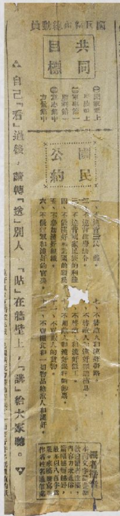
【第五十九版与第六十二版中缝】

没饭吃，没衣穿， 这种日子怎样活得成？ 要知道逃难不是生意经， 要活命只有和鬼子死拼！