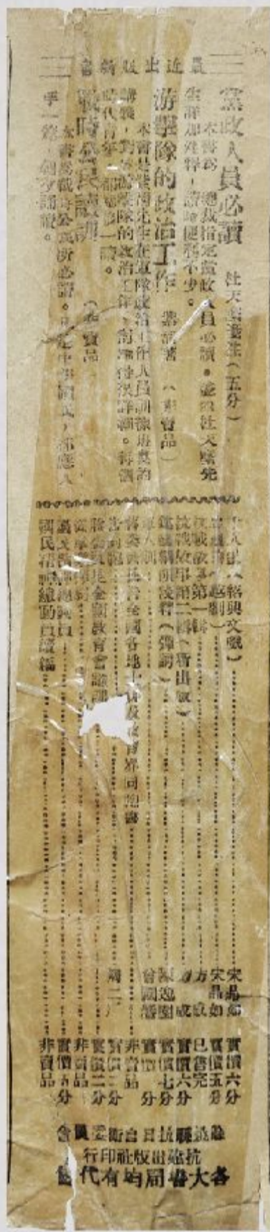
【第六十版与第六十一版中缝】